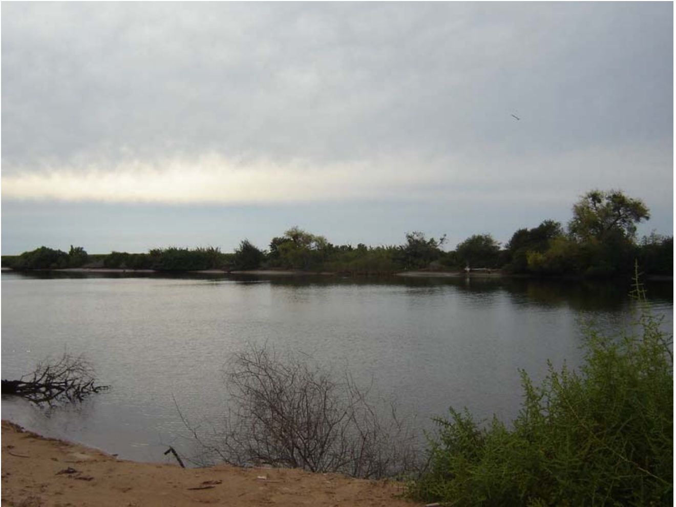
Agua salobre y sobrante con salida al mar en el área de El Tule

Esta agua se trasladaría al barco por medio de 2 mangueras flexibles de 8 pulgadas de diámetro y 3 kilómetros de longitud, las cuales estarían vaciando dentro de la cisterna y al termino del llenado, solo se dejarían reposar sobre el lecho marino y con boyas para rápidamente volverlas a localizar en el siguiente viaje.